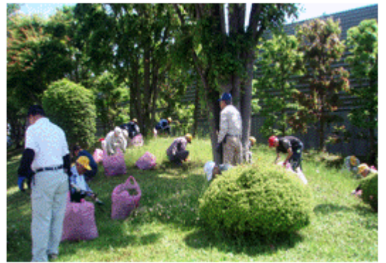
みんなで協力、きれいになりました (市役所敷地内にて)

日（月）に実施されました。今年、あきる野市役所敷地内、秋川駅前南・北口広場、武蔵増戸駅前森の下公園周辺、武蔵五日市駅前周辺で実施しました。