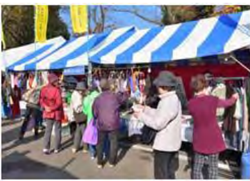
毎年、大勢のお客さまです