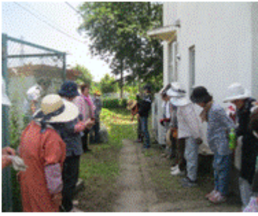
暑さ対策もバッチリ、 いい汗かきました

6月4日にシルバーセンター敷地内の除草を行いました。30名の参加があり、回を重ねるごとに参加者が増えてきました。男性の方々のご協力もいただき、きれいになりました。ありがとうございました。